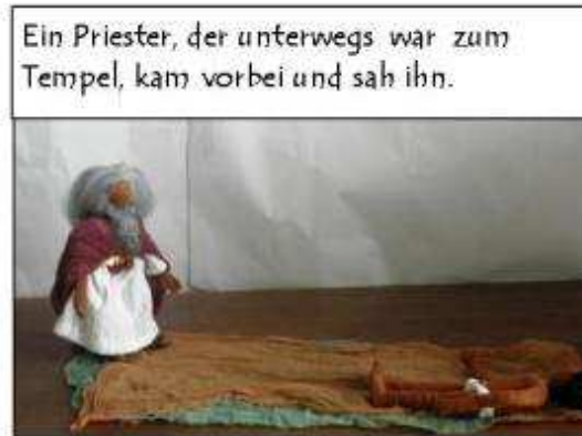
Ein Priester, der unterwegs war zum Tempel, kam vorbei und sah ihn.