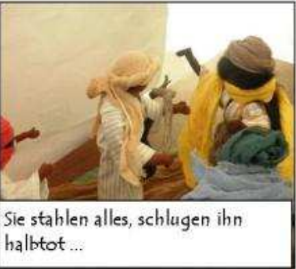
Sie stahlen alles, schlugen ihn halbtot...