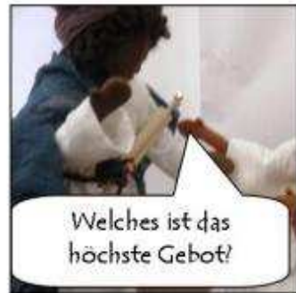
Welches ist das höchste Gebot?