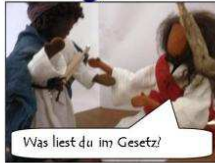
Was liest du im Gesetz?