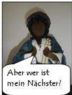
Aber wer ist mein Nächster?