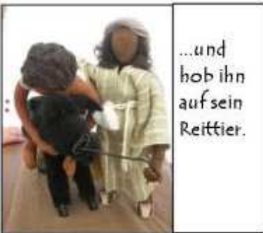
...und hob ihn auf sein Reittier.