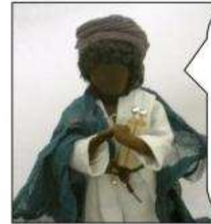
Du sollst den Herrn deinen Gott lieben von ganzem Herzen und mit aller Kraft und deinen Nächsten wie dich selbst.