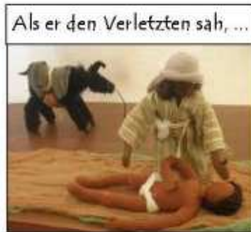
Als er den Verletzten sah, ...