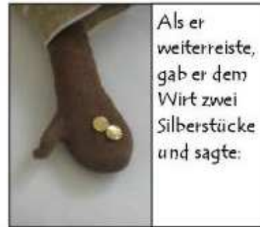
Als er weiterreiste, gab er dem Wirt zwei Silberstücke und sagte: