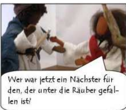
Wer war jetzt ein Nächster für den, der unter die Räuber gefallen ist?