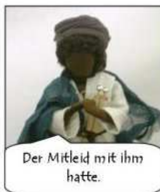
Der Mitleid mit ihm hatte.