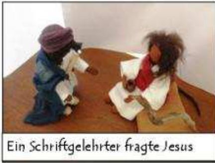
Ein Schriftgelehrter fragte Jesus