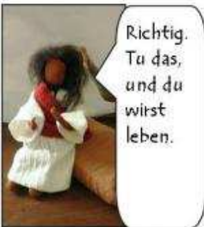
Richtig. Tu das, und du wirst leben.