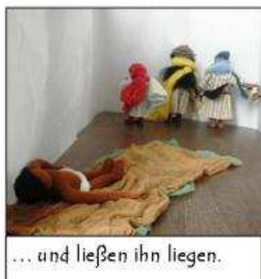
... und ließen ihn liegen.