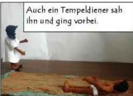
Auch ein Tempeldiener sah ihn und ging vorbei.