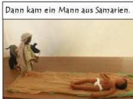
Dann kam ein Mann aus Samarien.