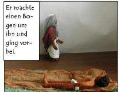
Er machte einen Bogen um ihn und ging vorbei.