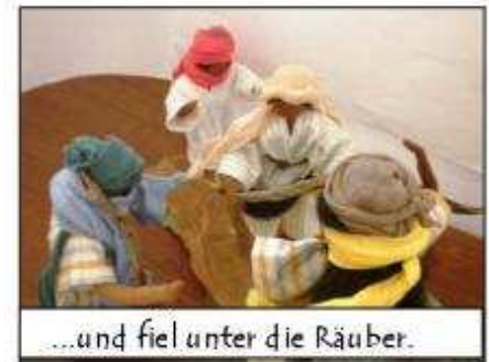
...und fiel unter die Räuber.