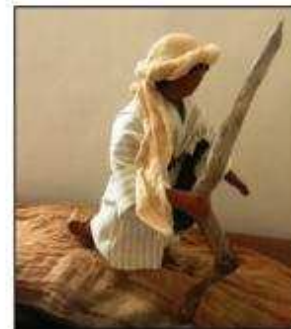
Ein Mann ging von Jerusalem hinunter nach Jericho