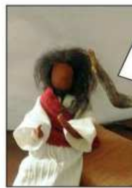
Genau. Drum geh und handle du genauso.