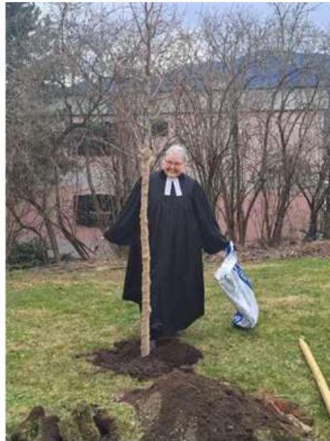
Es war ein wirklich schönes Fest!