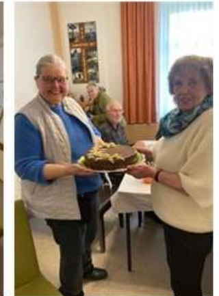
Eine Torte von Waltraud Eckstein und viele weitere Geschenke